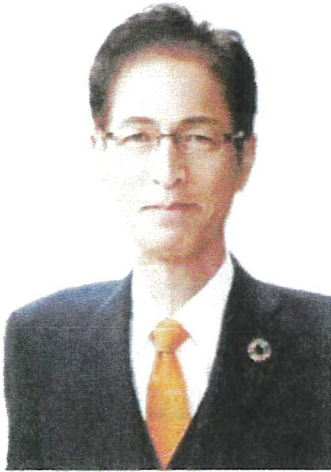
水野 達夫 滑川市長